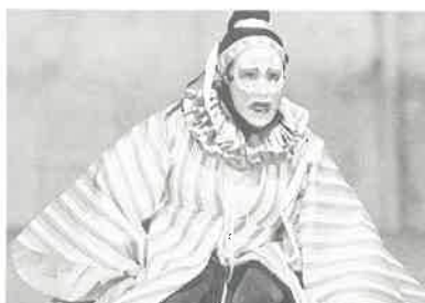
Masque Stiefel, Théâtre du Soleil (Shakespeare)