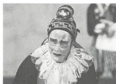
Masque Stiefel, Théâtre du Soleil (Shakespeare)