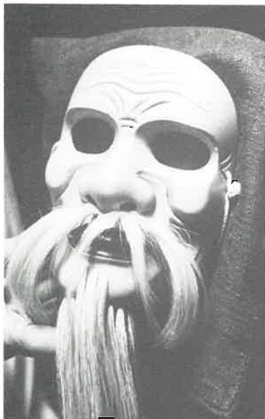
Masque de Stiefel