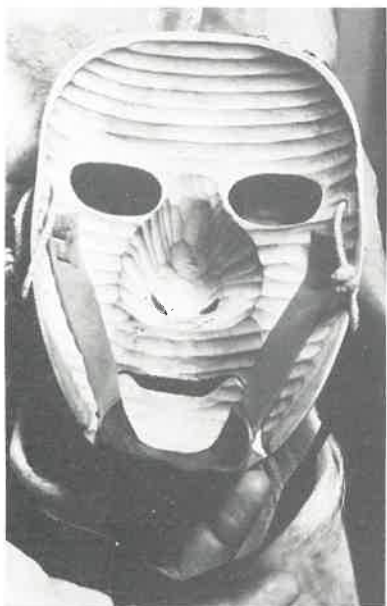
Intérieur du masque