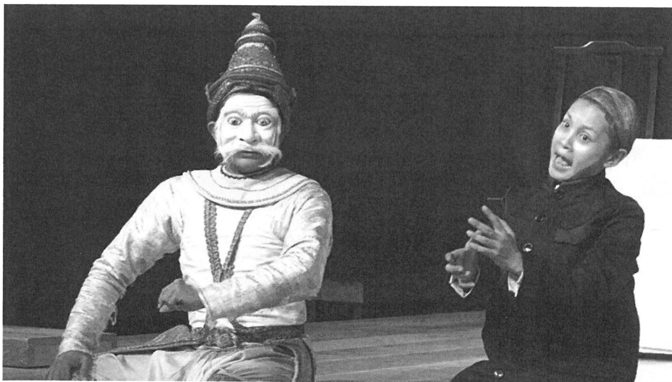
Scène de la pièce : dialogue entre le Prince Sihanouk et le Roi Défunt, NORODOM Suramarit en 1985, (en haut) et en 2013 (en bas).