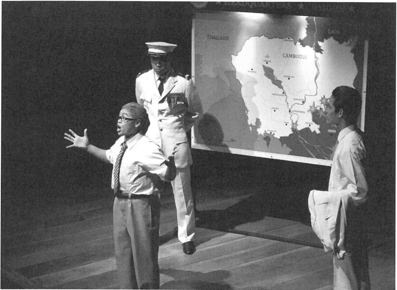
SAN Marady, dans la mise en scène de Georges BIGOT et Delphine COTTU en 2013