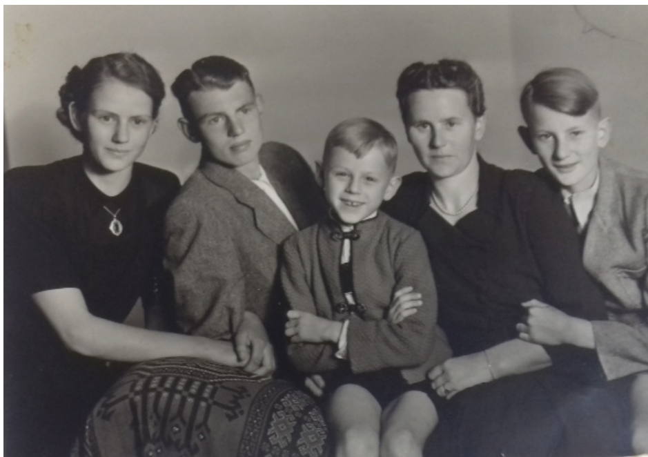
Après la récolte (1953).